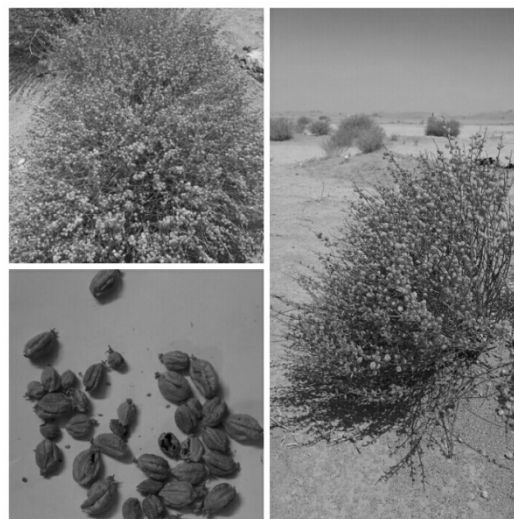
شکل ۱- گونه شمع بیابانی ( Ochradenus ochradeni )

تا 20/4 درصد گزارش کردند. آسکوا و همکاران (۲۰۱۶) ۱ به تعیین کیفیت Soybeans (سویا) با روش NIR پرداختند. که این روش در مطالعه کیفیت آن مفید واقع شد. ارزانی و همکاران (۲۰۱۵) به بررسی میزان (N) و الیاف نامحلول در شوینده اسیدی (ADF) در گرامینه‌های مرتعی در سه مرحله رویشی، گلدهی و بذردهی پرداختند دامنه تغییرات N برای همه نمونه‌ها بین 1/54 و 1/15 ٪ و برای ADF برابر 42/14 و 44/72 درصد بود. بالویی و همکاران ۲ (۲۰۱۳) به پیش‌بینی کیفیت علوفه مراتع زیمباوه پرداختند. برای Vigna unguiculata مقدار CP، Ash، NDF و ADF برابر 12/7 ، 8/3 ، 49 و 33/9 به دست آمد. هدف این تحقیق، تعیین کیفیت علوفه گیاه شمع بیابانی برای چرای نشخوارکنندگان به عنوان گیاه ارزشمند منطقه ابرکوه در سه دوره رویشی، بذردهی و خواب گیاه به ترتیب در فصل بهار، تابستان و پائیز و بررسی روند تغییرات کیفیت علوفه و تعیین زمان مناسب چرای دام در مرتع مورد بررسی می‌باشد.